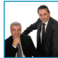
Laboral Miquel Campmany i Josep Maria Bosch