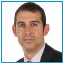
Fiscal Ramon Soler